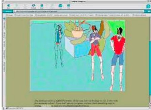
Harold Cohen (AARON)

para hacer dibujos grandes en hojas de papel colocadas en el piso. Desde esta incursión temprana en la inteligencia artificial, Cohen ha seguido afinando el programa AARON a medida que la tecnología se vuelve más sofisticada.